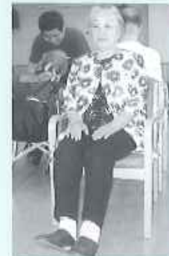
足上げ頑張ってます。

歩行時間、ボール投げならぬおじゃみ投げ、握力測定、椅子に座って の足上げ等を行いました。ご利用者の筋力や 体力を把握し、足の筋力や握力を強化できる ような体操等を取り入れ、今後の体力の維持 増進を図っていきたいと思います。