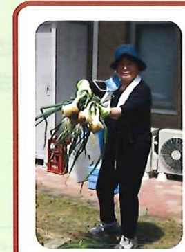
採れたての玉ねぎです！