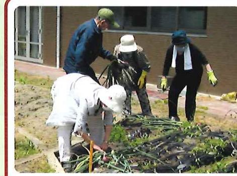
みなさん夢中です！