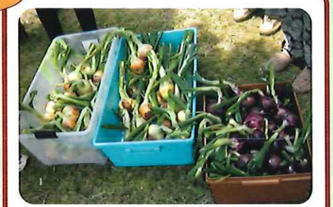
たくさん、とれたよ！