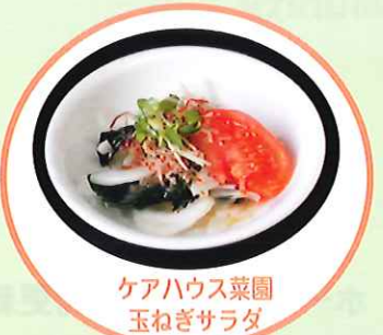
ケアハウス菜園 玉ねぎサラダ

毎年定番化しつつある玉ねぎの収穫を行いました。今年ではできばえが心配でしたが、収穫してみると立派に育っていました。採れた玉ねぎは厨房で調理してもらい、美味しくいただきました。