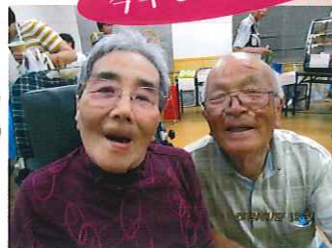
川西市障害者共同作業所あかね