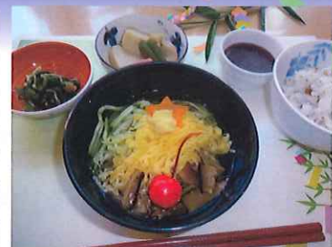
ケアハウス花屋敷