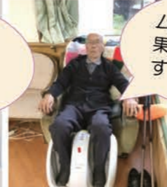
フットマッサージ機