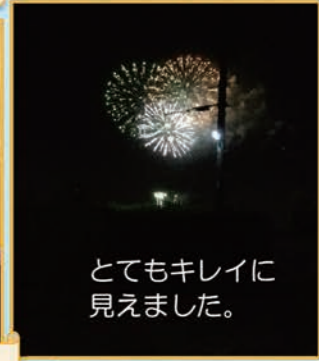
とてもキレイに 見えました。