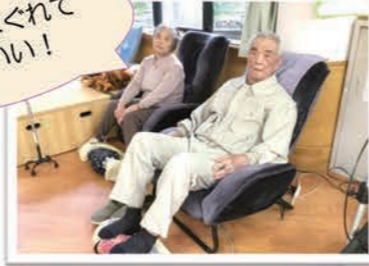
全身マッサージ機