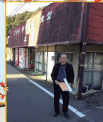
相変わらず 見事だな〜