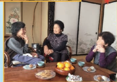
昔話に花が咲きます