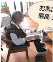
足裏マッサージ機