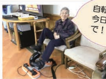
ルームマーチプロ