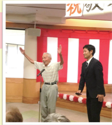
すばらしい万歳三唱でした。