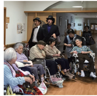
ヒゲダンスを演る2人