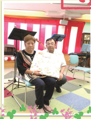
ボランティアさんもお祝いして下さいました。