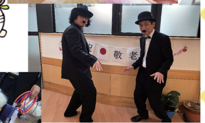
皆様の笑顔が 我々職員の活力の源です。