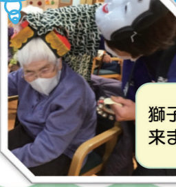
獅子舞も 来ました!