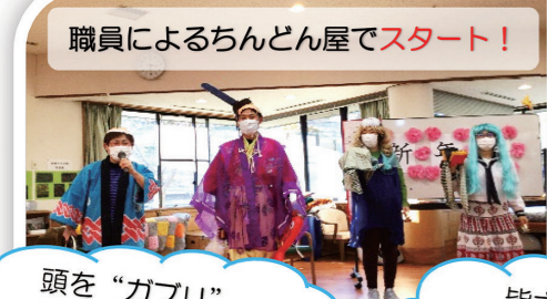
職員によるちんどん屋でスタート!