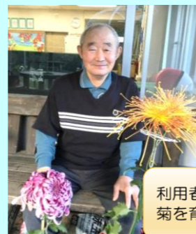
利用者様一人ずつ菊を育てています。