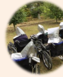
安全な避難場所へ移動！