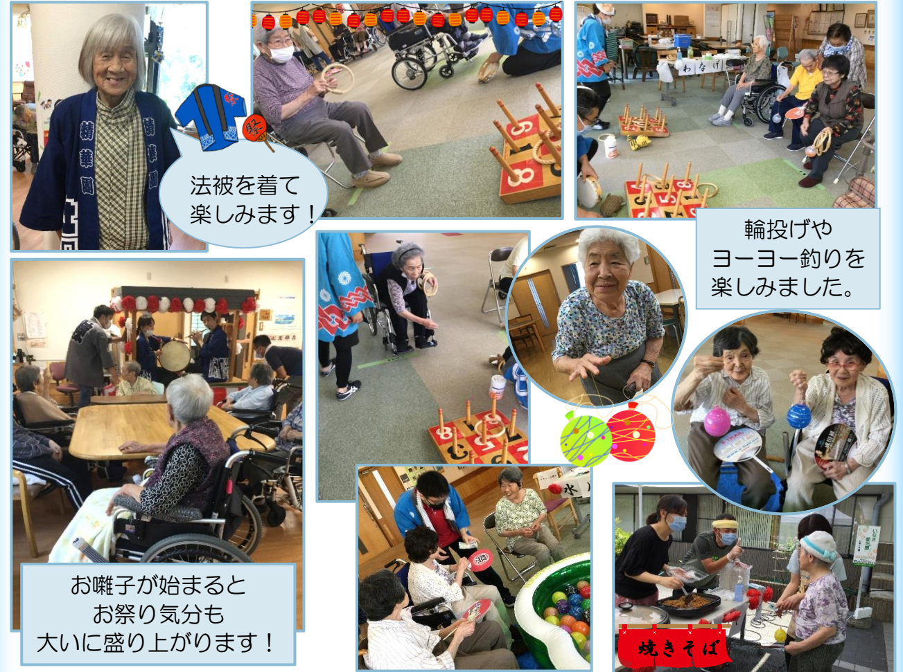
法被を着て 楽しめます！

園内でお祭りを開催いたしました。 外部の来店やご家族の来園はありませんでしたが 職員主催で色々な催し物を楽しんでいただきました。