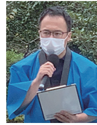
ご利用者さんが笑顔なのでうれしいですね