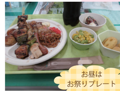
お昼はお祭りプレート