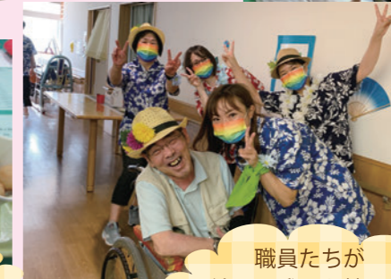
職員たちが練習の成果を披露！盛り上がりました！