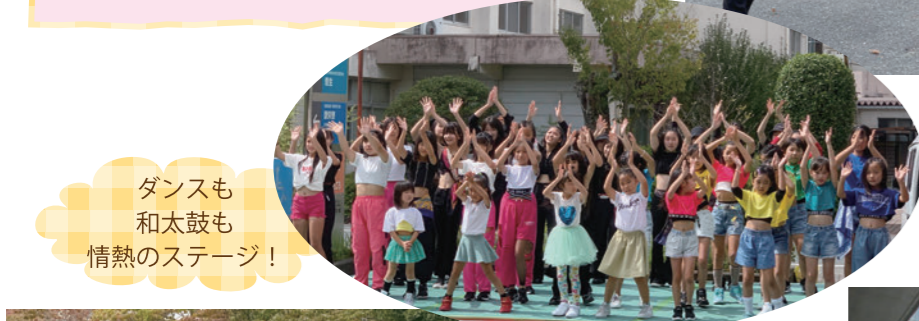
ダンスも和太鼓も情熱のステージ！