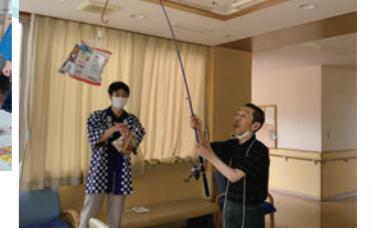
射的もお菓子釣りもみんな真剣！