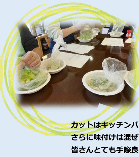
カットはキッチンバサミ、加熱は電子レンジだけ、 さらに味付けは混ぜるだけの簡単料理！ 皆さんとても手際良く取り組まれていました。