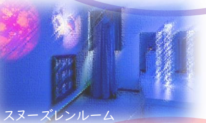
スヌーズレンルーム