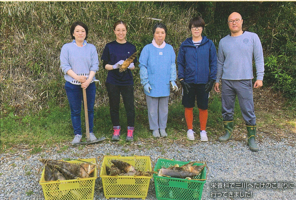
栄養科で三川へたけのこ掘りに 行ってきました!