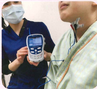
●バイタルスティム