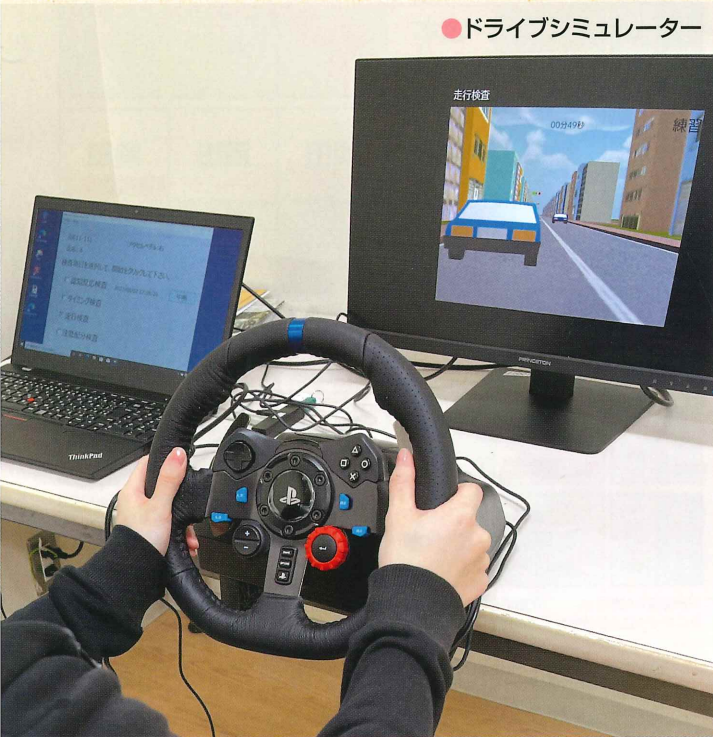
●ドライブシミュレーター