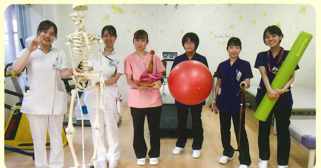
※感染に配慮し、撮影時のみマスクを外して撮影しています。

新入職員は作業療法士2名、言語聴覚士1名、看護師3名、看護助手2名の計8名が仲間入り。接遇・安全運転・医療安全・感染対策などの研修を行い、社会人としての心得を学びました。今後は専門的な基礎知識を更に深め、患者さんだけでなく地域の方々からも信頼を得られるような医療者になれるよう、精進していきます!