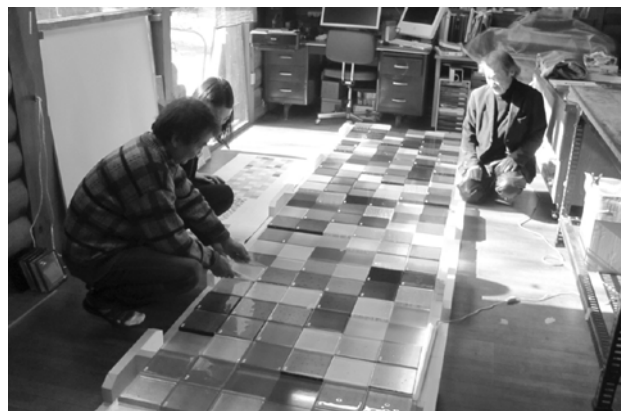
▲レリーフアートの作成風景

新棟西側部分を建築している1期工事が今月中に完了し5月中に引越しを行い、6月には新しい玄関からご利用の皆さまをお迎えする予定です。その玄関壁面にレリーフアートを設置します。このレリーフアートは、ご利用の皆さまをお迎えするにふさわしいフォーマルな顔として、エントランス正面を飾る象徴的な存在として、希望の光のような存在感あるアートワークです。