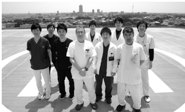
▲C棟屋上ヘリポートにて

救命救急センターは、24時間365日、受診される皆さんに満足頂ける医療を提供し続け、近隣の皆さんやかかりつけの方々が安心して日常生活を送れるよう日々努力しています。