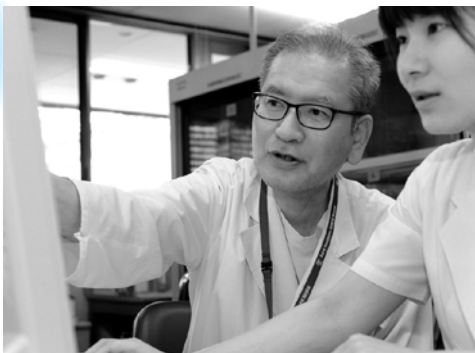
▲血液検査データの解析