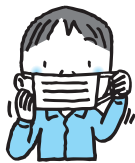
ゴムひもを耳にかける