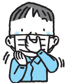
鼻と口の両方を確実に覆う