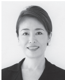
安藤 優子 氏

キャスター/ジャーナリスト 元フジテレビ 「FNN スーパーニュース」メインキャスター