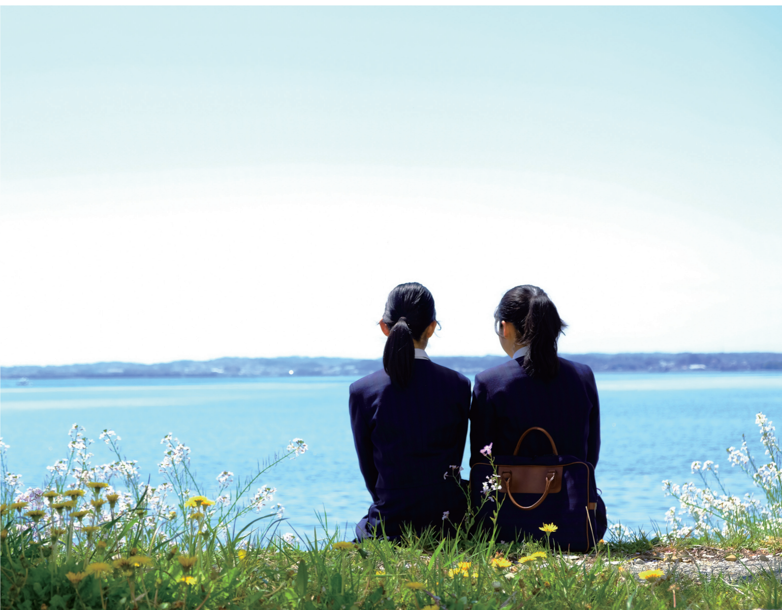
こちらの写真は、浜松学芸中学校・高等学校の生徒さんの作品です。 ▶生徒さんのことは… 浜名湖は四季折々に様々な表情を見せてくれます。私たち浜松学芸高校社会科学部は、そんな地元の魅力を探して活動しています。そんな中でふと見つけた春の浜名湖の景色は、私たちの宝物です。