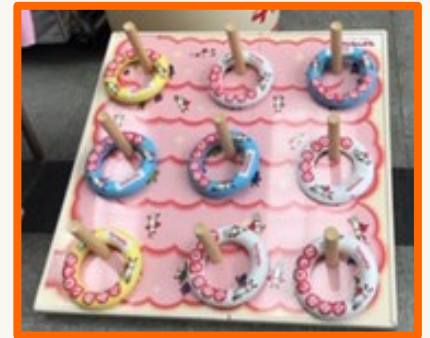
輪投げをしてヤクルトをもらおう!