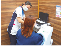
血圧測定 血管にかかる圧力を測ります。