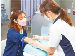
採血 血液を採取してさまざまな数値を調べます。