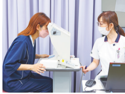
視力検査 裸眼・矯正視力を調べます。