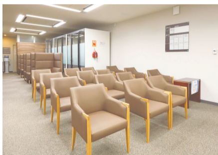
待合室 落ち着いた色調の室内と個別椅子

受けられなかった方の中には、「多 忙で、丸1日仕事を休んで人間ドッ クに行くのは難しい」という意見が 多く、そういう方にどう人間ドック を提供していけばいいのだろうか と検討した結果、約3時間で受けられ る人間ドック「クイックドック」であ れば役に立つという解決案に至った のです。クイックといっても、検査内 容や精度は1日ドックと全く同様 です。結果をその場で出せる血液検 査などと出せないものがあります。