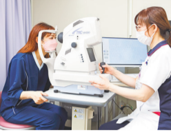
眼底検査 白内障、緑内障、動脈硬化などを調べます。