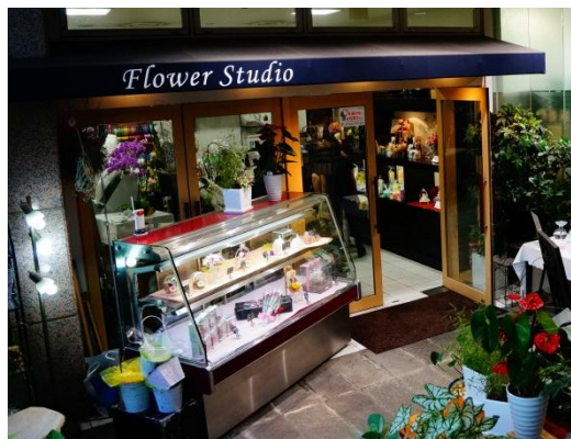
フラワースタジオ(外観)