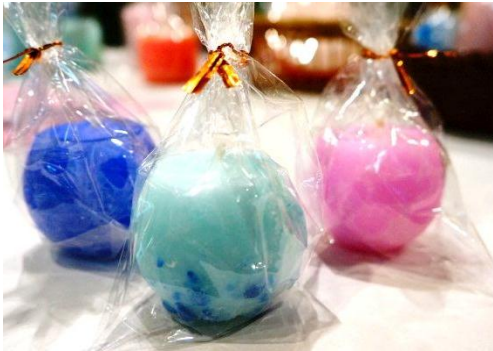
アロマキャンドル(小) 300円