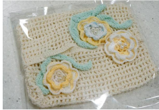
ポケットティッシュケース 1000円