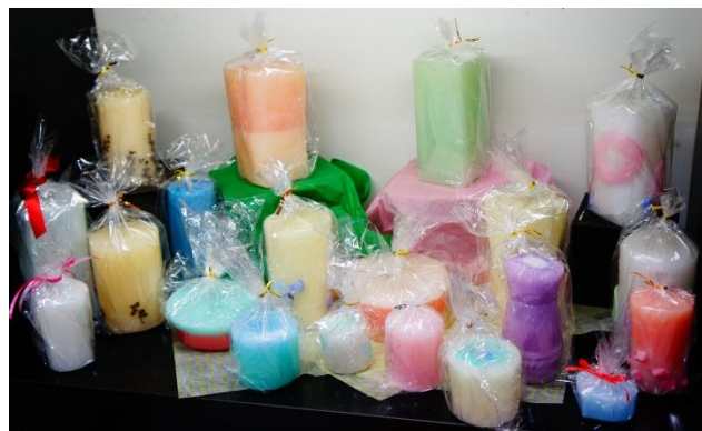
とってもカラフルなアロマキャンドル