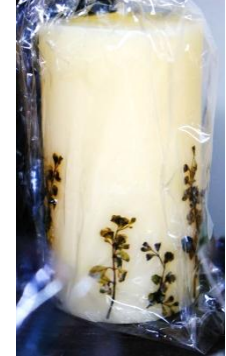
アロマキャンドル(大) 500円