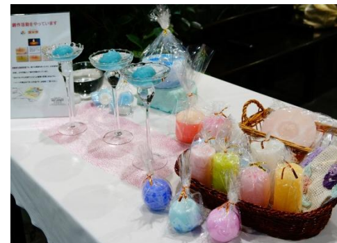
本日は特別に入口にも販売の スペースを設けていただきました