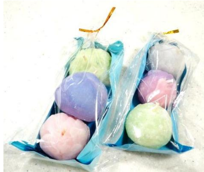
アロマキャンドル(小) 300円