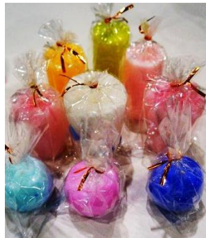
ミント、ラベンダー等、 色々な香りをご用意！

アロマの香りやキャンドルのゆらゆら揺れる炎には癒し効果があります。 また、私たちの商品に使用しているキャンドルは、結婚式場のキャンドルを再利用して作っていますので、“幸せのキャンドル”として多くの方に広まっていくと嬉しいです。 今後も季節の限定商品や新商品をどんどん作っていきます！