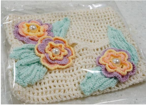
ポケットティッシュケース 1000円