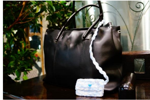
カード入れはsuicaやナイスパスを入れて定期券入れとしても使用可！

ポケットティッシュケースやカード入れは制作に集中すると1~2日で完成します。 一つ一つ心を込めて、丁寧に作りました。