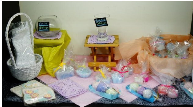
お菓子のようなキャンドルも販売！