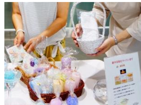
ご利用者が自分たちで商品を 納品・陳列されました