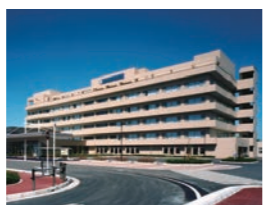
聖隷佐倉市民病院