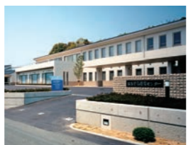
聖隷おおぞら療育センター

特別養護老人ホーム「浦安愛光園」(千葉県浦安市)、老人保健施設「浦安ベテルホーム」(同)、診療所「浦安せいらいクリニック」(同)等、開設。おおぞら療育センターが社会福祉法人小羊学園より聖隷福祉事業団へ事業継承され、「聖隷おおぞら療育センター」(静岡県浜松市)に。