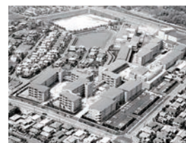
奈良ニッセイエデンの園

「ウェル・エイジング・プラザ奈良ニッセイエデンの園」(奈良県北葛城郡)開設(財団法人ニッセイ聖隷健康福祉財団との共同事業)。特別養護老人ホーム「横須賀愛光園」(神奈川県横須賀市)開設。浜松市重度身体障がい者地域生活支援事業用住宅「シオンハウス」開設。