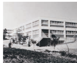
聖隷浜松病院一号館