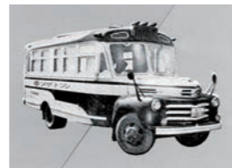
胸部レントゲン検診車