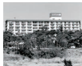
浜名湖エデンの園

法人名称を「社会福祉法人聖隷養護園」から「社会福祉法人聖隷福祉事業団」に改称。「聖隷病院」を「聖隷三方原病院」に改称。高齢者世話ホーム「浜名湖エデンの園」(静岡県現:浜松市)開設。知的障がい者更生施設「やまばと成人寮」(静岡県現:牧之原市)開設(1979年社会福祉法人やまばと学園に)。