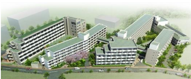
浜名湖エデンの園 全体鳥瞰図

浜名湖エデンの園は、1973年（昭和48年）に1号館を開設し、1976年（昭和51年）に2号館を設置。その後、現在6号館まで増築や耐震対策を行ってきましたが、さらなる入居者の安全・安心の確保のため、この度の建替えに至りました。 鉄筋コンクリート造の有料老人ホームの建物では日本最大規模となり、入居者が生活をする中での大規模な建替え工事は、国内初となります。