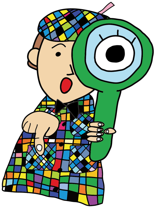
ナツケンキャラクター ナツケンくん