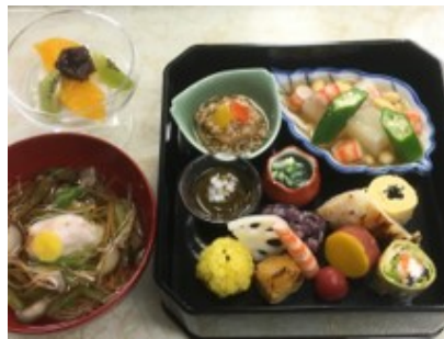
開発中の健康食（写真はイメージです）