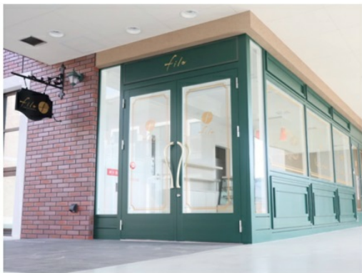
“きずなができるお菓子屋さんfilo(フィーロ)”