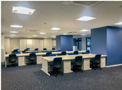
事務センター “オフィスハマガク”