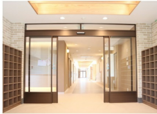
天竜杉を使用した中央廊下天井幕板