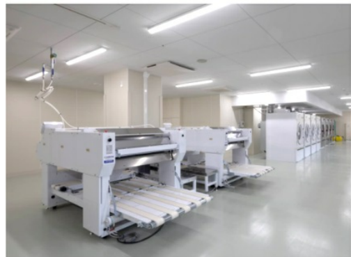
リネン工場 “ランドリーセンター”