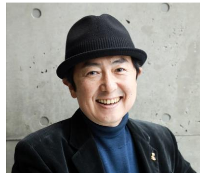
特別講演 フリーアナウンサーの笠井信輔氏