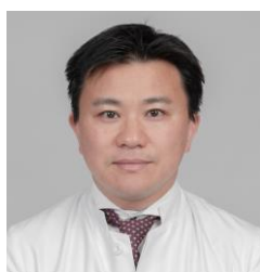
循環器副センター長 兼心臓血管外科 部長

日本内科学会認定医／指導医,日本循環器学会専門医,日本高血圧学会指導医／専門医,臨床研修指導医講習会修了,植込み型除細動機／ペースングによる心不全治療研修履修