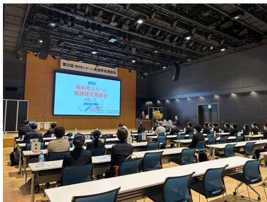
2023年 第2回 開会式