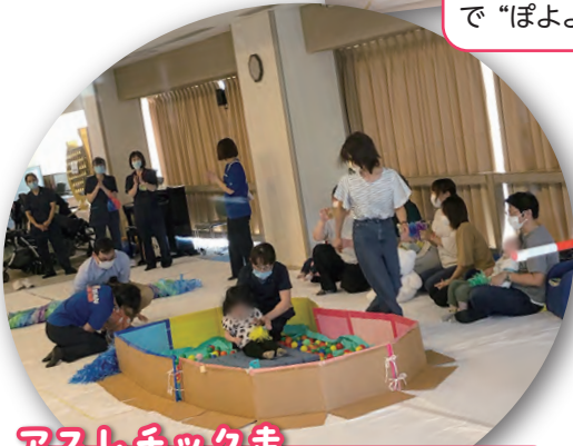
アスレチック走 スズランテープのカーテンをくぐって、ボールスライダーを滑り、お花の風船を引っ張り、とってゴール！！親子の微笑ましい姿に、会場が笑顔で溢れました。