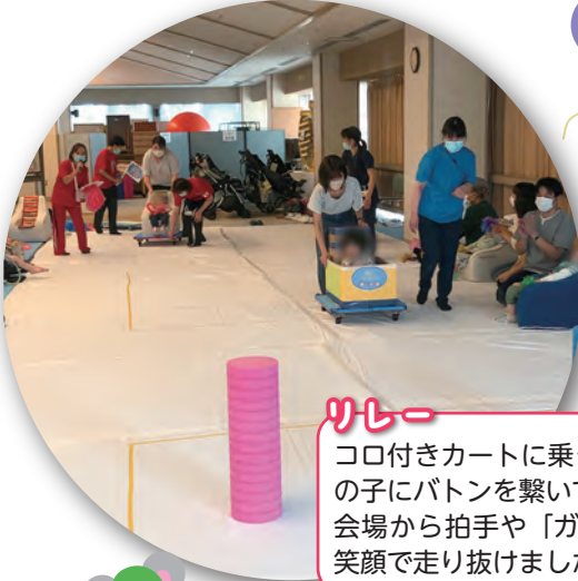
リレー コロ付きカートに乗って会場を往復し、次の子にバトンを繋いでいきました。会場から拍手や「ガンバレ」の声援の中、笑顔で走り抜けました。

10月9日に、運動会を行いました。午後にはお天気にもなり、絶好の運動会日和となりました。ひかりの子の12名全員、保護者のみなさんも多数参加してくださって、盛大な、楽しい会になりました。ひかりの子のこどもたち、ひとりひとり、元気に精一杯がんばっている姿がとてもまぶしかった一日でした。