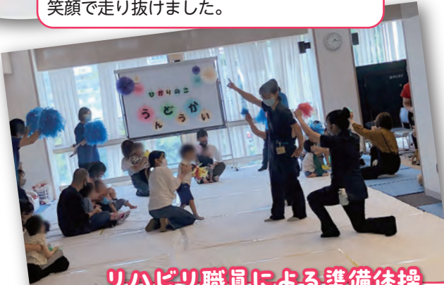
リハビリ職員による準備体操 「ぼよん行進曲♪」に合わせて、みんなが“ぼよよ～ん”と高く飛び上がりました！