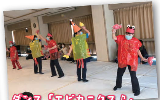
ダンス「エビカニクス♪」 ノリノリの曲に合わせて、エビとカニに扮した職員が登場！ 体を大きく動かし、みんなでおどって盛り上がりました。