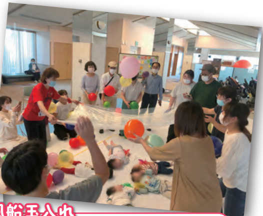
風船玉入れ 紅組と青組で勝敗を競い、子どもの部と大人の部を行いました。大人の部で、おうちの人達が夢中になって投げ入れる風船の動きを、子どもたちは透明シートの下から見楽しみました。