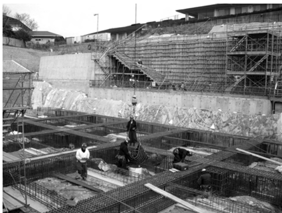
地下部分は免震ピットとなります。基礎配筋工事を行っており、この後コンクリートで固めて、その上に免震装置を据え付けます。