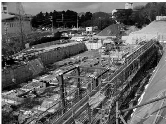
基礎工事を行っています。3号館は免震建築物のため、およそ3.5メートルの深さまで掘削しています。