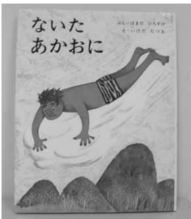
ないたあかおにの絵本

家の本棚には頂いた絵本が数多くあります。その中に私の兄がすすめてくれた「ないたあかおに」があります。登場する赤おには心の優しいおにだけれど、その姿から内面を正當に評価されず、村人は彼を恐れ近づこうとはしません。赤おには村人と仲良くなりたい事を友達の青おにに相談します。青おにはわざと村人を襲い、赤おには村人を助ける芝居をするのです。赤おには村人と仲良くなるけれど、青おには人間・赤おにの前から姿を消してしまいます。友情を描いた胸が熱くなるお話です。