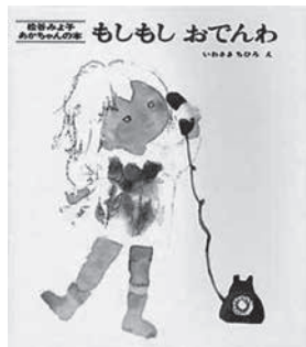
松谷みよ子文／いわさきちひろ絵 童心社1970年発行