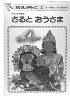
川原佐公文／遠竹弘幸絵 ひかりのくに1982年発行