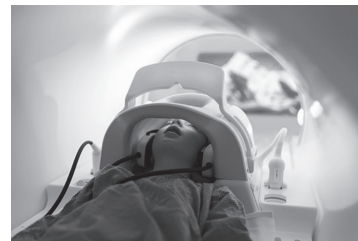
疑似体験を可能とする視覚効果 (Ambient Experience)