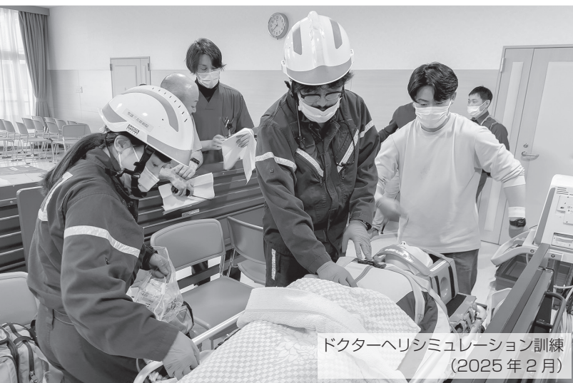
ドクターヘリシミュレーション訓練 (2025年2月)

もし南海トラフ巨大地震が発生した場合、静岡県では地震や津波による大きな被害が発生する事が予想されています。そうした時に、当院は「災害拠点病院」として、また「ドクターヘリの本部」として、地域の皆さまの命を守るための大切な役割を担います。