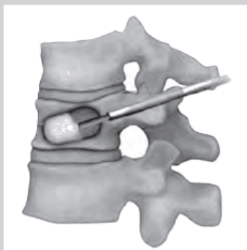
風船を抜き、空間をセメントで固める。