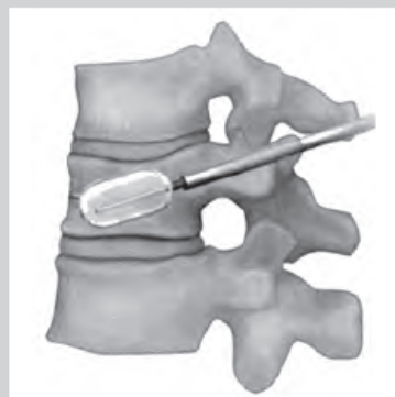
潰れたせぼねへ風船をいれ膨らませ、元の形に近づける。