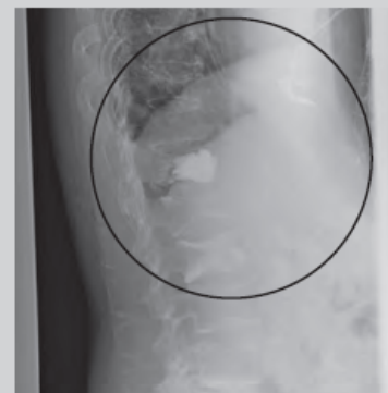
治療後のレントゲン写真