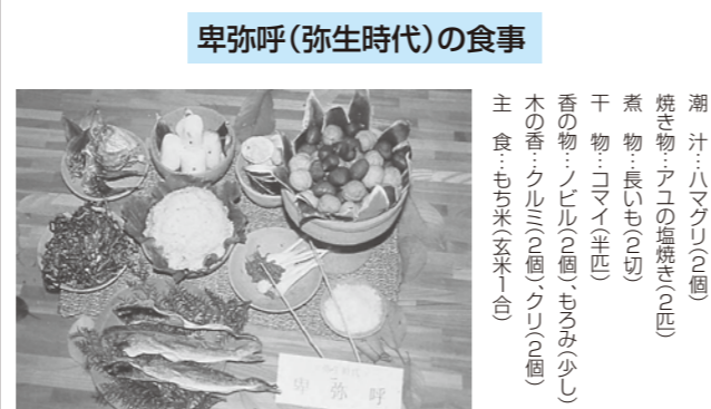
図3 邪馬台国の女王卑弥呼の食事の再現