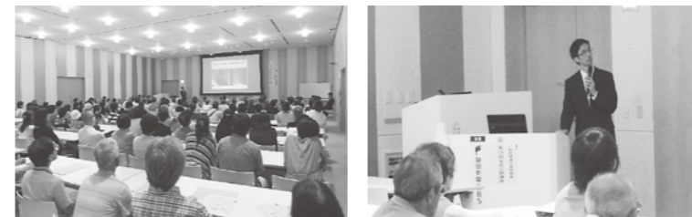
(文:経営企画室 渡邊 健)