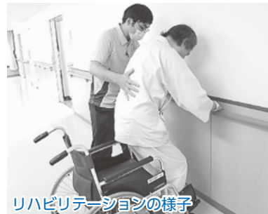
リハビリテーションの様子

地域包括ケア病棟では、在宅復帰に向けて調整・支援をしています。急性期の治療(点滴・処置)を終え医師から退院許可が出ても、家での生活に不安を感じることがあります。そのような時、当院では地域包括ケア病棟に移動していただき、自宅退院に自信がもてるようなお手伝いをさせていただいています。また、地域で生活をしている方々の介護サポートもしておりますので、お気軽にご相談ください。