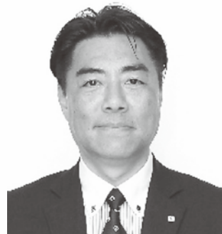
沼津市長 頼重 秀一

当法人は、7月に創立70周年を迎えます。 本誌に、感謝メッセージを連載で掲載させていただきます。