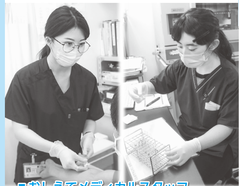
■おしえてメディカルスタッフ Lesson2 検査課「臨床検査技師」