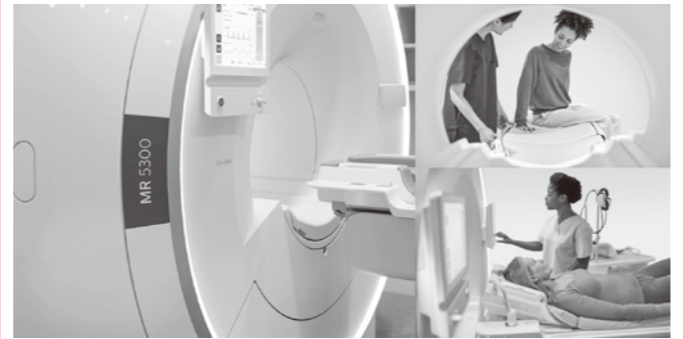
文責 放射線課 坪内