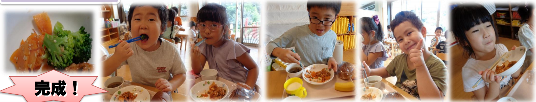
③袋のなかで混ぜます

いろいろな あじがあるよ！ ・塩昆布 ・かつおぶし ・ゆかり ・しょうゆ ・ごま油