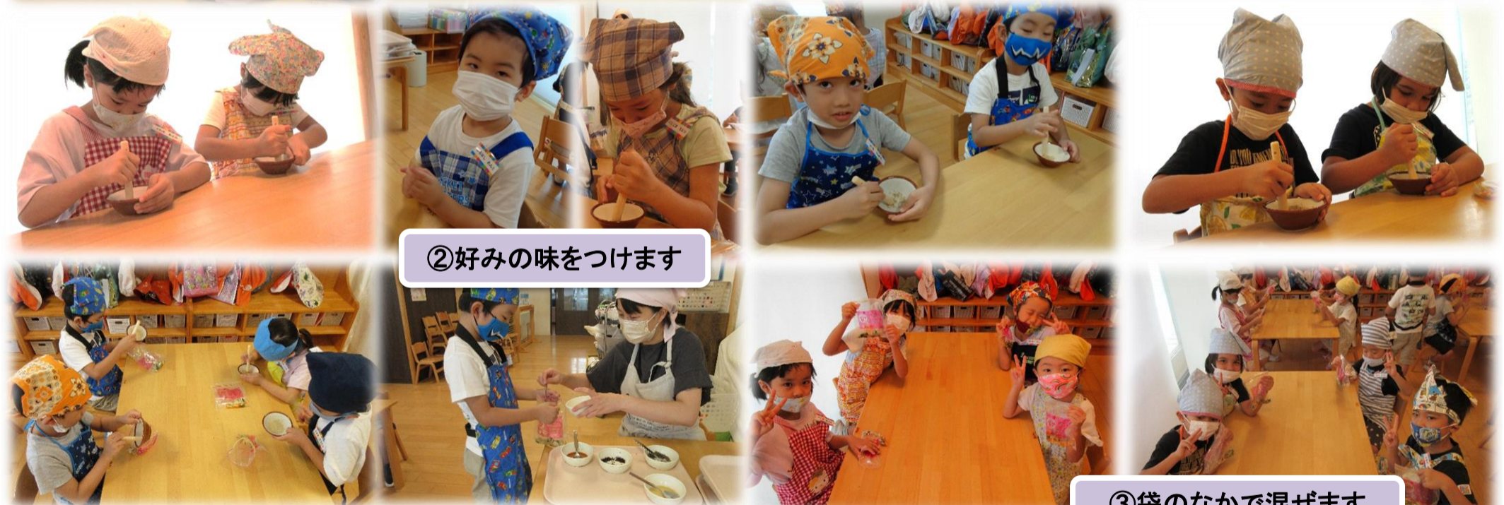
③袋のなかで混ぜませ