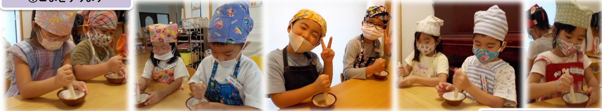
②好みの味をつけます