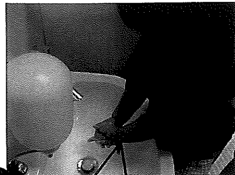
ひよこ組は一緒に洗います