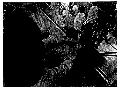
りす組では一人で出来るようになります