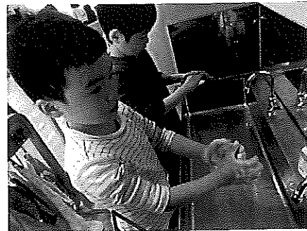
すみれ組はとても上手です

新型コロナウイルスの感染がひろがっています。感染予防のためにはお一人お一人の咳エチケットや手洗いがとても重要です。手洗いを子どもは上手に出来ないことがあります、家でも手洗いの習慣を一緒につけてくださいね。