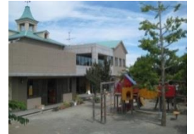
支援ひろばおひさま