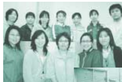
←「けいあい」のスタッフです