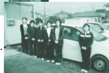
「かみや」のスタッフです→

私たちが在宅事業部（けいあい・かみや）は、居宅介護支援（ケアプラン作成）と訪問看護サービスの提供をしています。皆様が、住みなれた自分のお家で過ごせるようお手伝い致します。