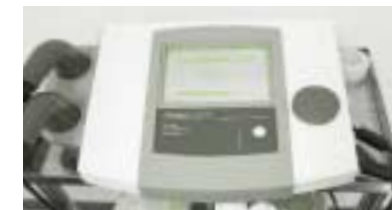
リハビリテーション課